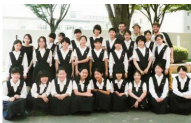
〈中1〉イングリッシュキャンプ