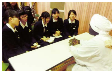
〈中2〉JICA研修員との交流