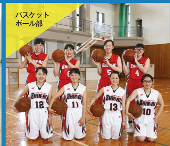
バスケット ボール部