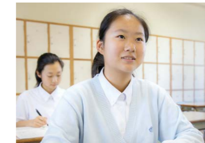
国際ASコース・アドバンス【中学校】

入試により選抜されたグループです。難易度の高い授業や特別講座を実施。英語運用能力、国際感覚を身につけます。学力伸長と希望により医系進学コースへ変更の実績もあります。