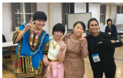
〈高1〉グローバルキャンプ