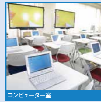
コンピューター室

一人ひとりに十分な設備で学べます。パワーポイントなどを用いた発表などを通して、情報共有や表現力を磨きます。