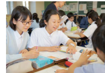
医系進学コース【中学校】

医歯薬学部を中心とした国公立理系学部入試に対応する一貫コース。高度な学力はもちろん、医療人として国内外で活躍できるよう、豊かな人間性を育み、医療人としての使命感を育てます。