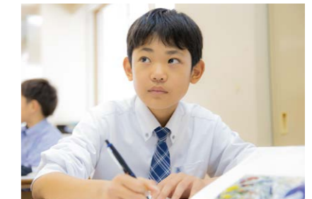
国際ASコース【中学校】

入試により選抜されたグループです。難易度の高い授業や特別講座を実施。英語運用能力、国際感覚を身につけます。学力伸長と希望により医系進学コースへ変更の実績もあります。