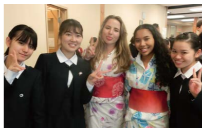
〈高2〉カナダ修学旅行