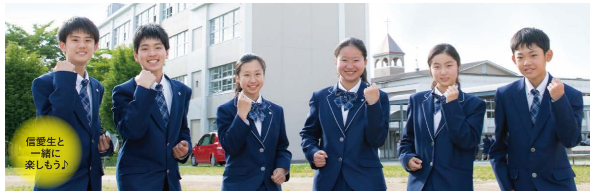
▶ イベントの、時間や内容の最新情報はホームページをご覧ください。

CHECK ▶ 公式ホームページ、リニューアルしました。 ▶ 西鉄久留米駅の電照看板、リニューアルしました。