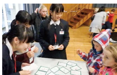
〈中3〉ニュージーランド研修