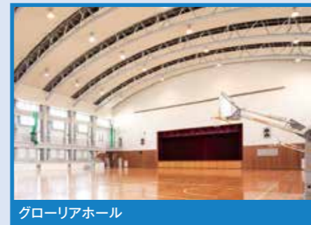
グローリアホール

体育の授業の他、体育系部活動の練習・試合に利用されています。また、学院全体の、総合イベントの場としても活用されています。